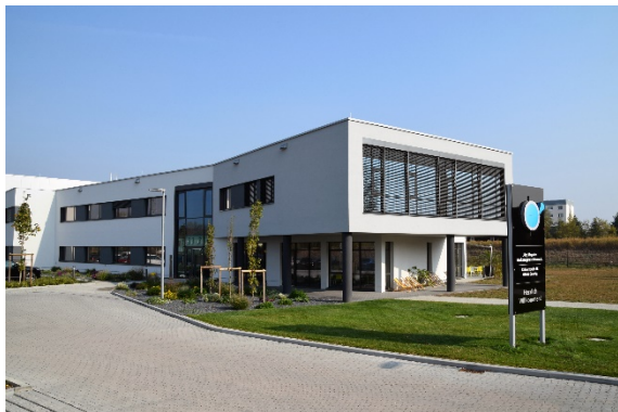
BU: Automatisierungszentrum in Coswig, Verwaltungsseite

Produkte: http://www.doosanmachinetools.com/de/main.do