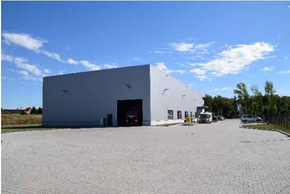
BU: Automatisierungszentrum in Coswig, Hallenseite