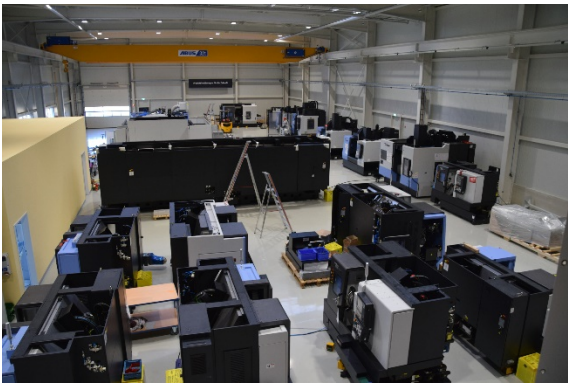
BU: Automatisierungszentrum in Coswig, Halle innen