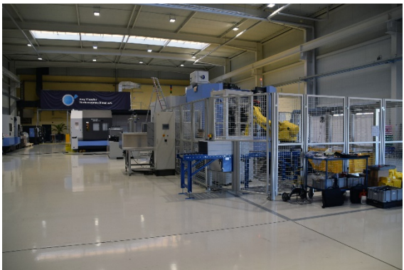
BU: Automatisierung